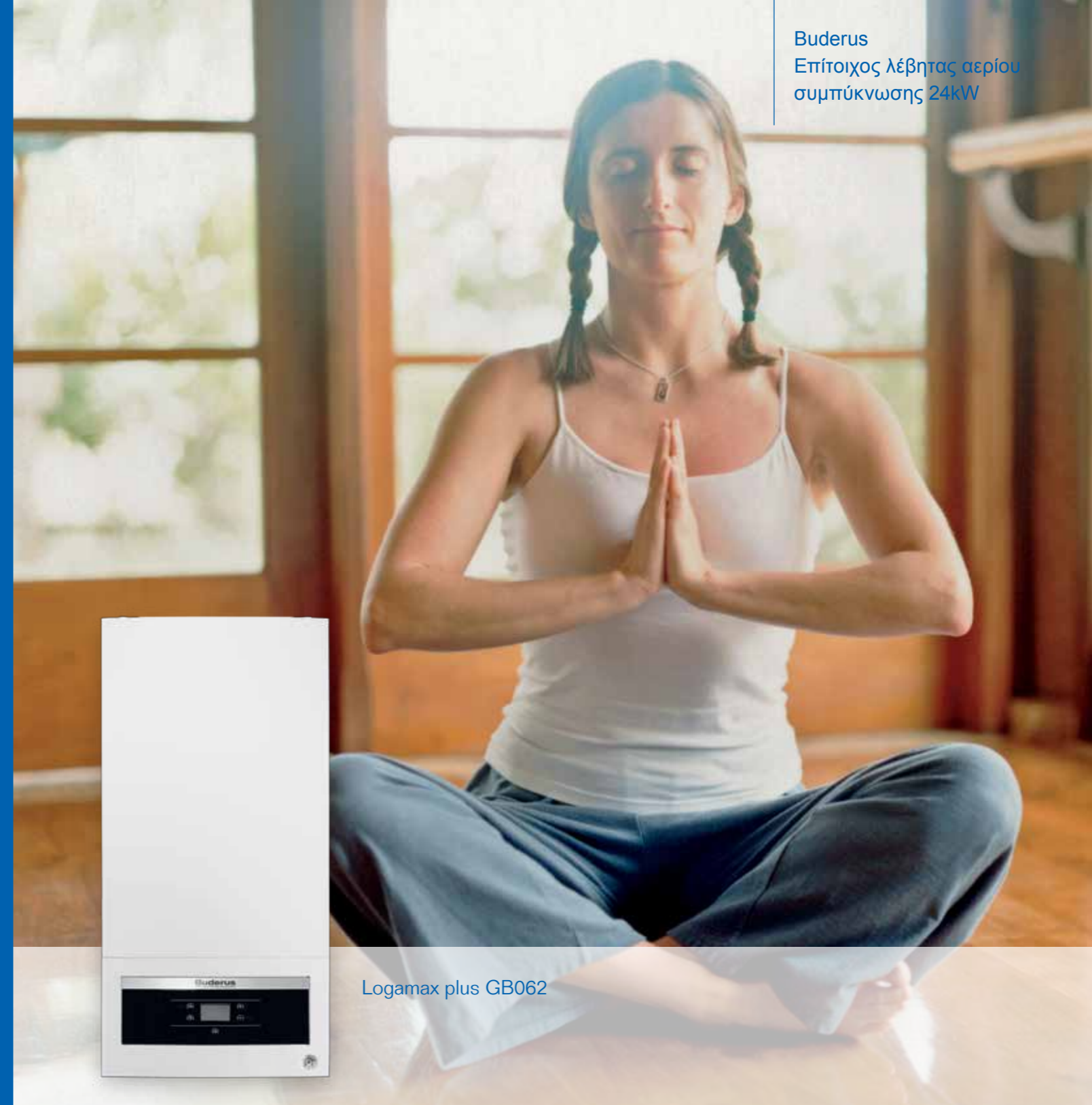
Logamax plus GB062

Buderus Επίτοιχος λέβητας αερίου συμπύκνωσης 24kW